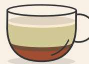
Dirty Chaï Latte